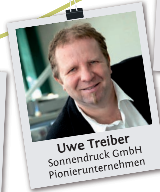
Uwe Treiber Sonnendruck GmbH Pionierunternehmen